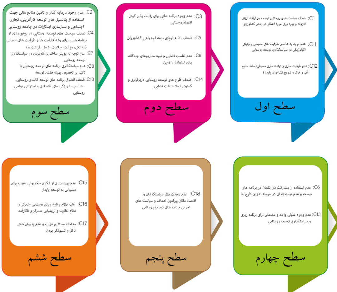
شکل ۲: رتبه‌بندی عوامل مؤثر بر نارسایی‌های سیاست‌گذاری توسعه روستایی در ایران