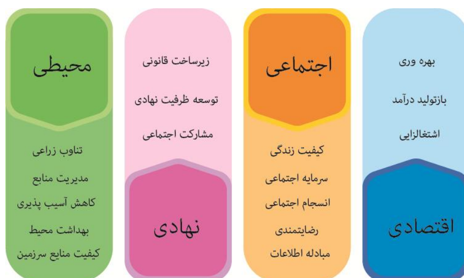
شکل ۱: مؤلفه‌های اساسی توانمندسازی روستایی

به عبارت دیگر، سردرگمی و ابهام در مسئله‌شناسی توسعه در ایران، مهم‌ترین پیامد غلبه برنامه‌ریزی توسعه بر سیاست‌گذاری توسعه است ( https://tme/spatial (planningTMU.2017) برای توسعه روستاها تاکنون الگوها و راهبردهای متعددی با نگرش‌های فضایی و غیرفضایی مدنظر قرار گرفته است (دولفقاری و صیدی، ۱۴۰۱: ۶۳)؛ اما لازمه زیست‌مندی سکونتگاه‌های روستایی، برخورداری از مؤلفه‌هایی است که آن را توانمند در جهت سکونت، فعالیت، رقابت، پویایی و