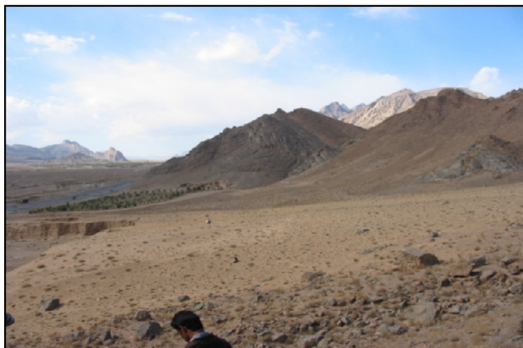
شکل ۳: کوهریگ فراشاه (تفت) در ۱۷ کیلومتری جنوب یزد. نگاه به سمت غرب. سطح کوهریگ از پوشش بوته‌ای و مواد واریزه‌ای پوشیده شده است. در قسمت پایین (سمت چپ شکل) برداشت جهت مصالح ساختمانی انجام شده است.

پدیده‌ی کوهریگ در اکثر بیابان‌های ایران به دلیل فعالیت‌های زمین‌ساختی و با توجه به رشته‌کوه‌ها یا کوه‌های منفرد باقی مانده از این فعالیت‌ها دیده می‌شود. کوهریگ‌ها، بسته به اینکه در چه موقعیت مکانی متراکم شده‌اند، از حداقل شیب (کمتر از ده درجه) تا حداکثر شیب مربوط به تراکم‌های ماسه‌ای (حدود ۳۵ درجه) را در بر می‌گیرند (مهرشاهی، ۲۰۰۱). ضخامت کوهریگ‌های بررسی شده در نقاط مختلف استان یزد از بیش از سی متر (شمال شرقی اردکان) تا حدود ۱۲ متر (حوالی فراشاه تفت، یزد شکل سه) و کمتر تغییر می‌کند (مطالعات شخصی). در این قسمت به نتایج مطالعاتی که در بخش‌هایی از استان یزد صورت گرفته است، اشاره می‌شود.