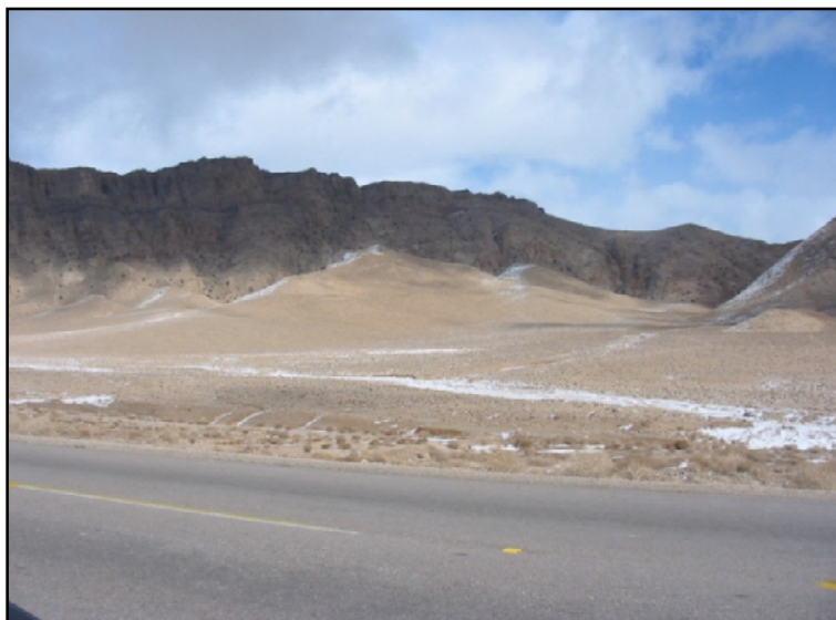
شکل ۱: نمونه‌ای از تراکم کوهریگ در دامنه کوه تنگ حوضکی یزد (جاده مهریز-ارنان) جنوب یزد. جهت حرکت کوهریگ از جنوب به شمال. سطح کوهریگ از پوشش گیاهی بوته‌ای انبوه و واریزه پراکنده پوشیده شده است.

هدف اصلی این مقاله، معرفی این پدیده، بررسی ویژگی‌های رسوب‌شناسی و موقعیت استقرار کوهریگ‌ها، نگاهی به بخشی از مطالعات انجام شده در این مورد در جهان و منطقه و نیز شناخت اهمیت مطالعه‌ی کوهریگ‌های ایران است. در واقع این مقاله سعی دارد تا بحثی و زمینه‌ای را تحت عنوان " کوهریگ‌شناسی " در ایران باز نماید. از آنجا که این نوشتار برای آشنایی علاقمندان به جغرافیای طبیعی ایران، به ویژه دانشجویان کارشناسی و کارشناسی ارشد و اساتید محترم، تهیه شده است، از بخش‌بندی و ساختار ویژه‌ی مناسب با این نوع مقالات بهره می‌برد.