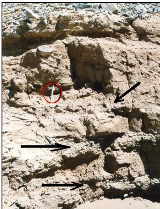
شکل ۴: مقطعی از بخش پایینی کوهریگ اصلی ۲۰ کیلومتری شرق اردکان (کوهریگ حوض سفید). پیکان‌ها لایه‌های آبرفتی را نشان می‌دهند. سطح کوهریگ کاملاً از واریزه پوشیده شده است. خودکار درون دایره به عنوان مقیاس است.

در حد ماسه بوده‌اند، موجب تغذیه‌ی حجم متنابهی از رسوبات ماسه‌ای در یک دوره یا دوره-های متعدد شده است که زمان آن به جز یک مورد بر ما روشن نیست. در این منطقه (کویر اردکان) بزرگ‌ترین کوهریگ یافت شده، تحت عنوان کوهریگ اصلی نزدیک معدن حوض سفید، مابین دشتی به ارتفاع تقریبی ۱۱۰۰ متر در فاصله ۱۸ کیلومتری شمال شرقی شهر اردکان و یکی از کوه‌های جدا افتاده از رشته خرائق به ارتفاع حداکثر ۱۸۶۵ متر (از سطح دریا) در دره‌ای که زین اسبی دارد متراکم شده است. مطالعه‌ی یک مقطع از این کوهریگ که توسط سیلاب بریده شده است، نشان داد که در این مقطع، حداقل ۲۵ متر از تناوبی از لایه‌های ماسه بادی، لایه‌های آبشسته دامنه‌ای و رسوبات واریزه‌ای عناصر تشکیل‌دهنده‌ی اصلی هستند (شکل چهار). طرز استقرار و شکل تراکم این کوهریگ در دو سوی تک کوه مذکور نشان می‌داد که ذرات ماسه‌ای در مدتی احتمالاً طولانی از سمت جنوب- جنوب شرقی آورده شده و به سمت مقابل رانده شده بودند به طوری که اختلاف ارتفاع پس‌ترین بخش کوهریگ (از کمتر از ۱۲۵۰ متری) و بلندترین بخش آن (در ارتفاع حدود ۱۳۶۰ متری) به بیش از یک‌صد متر می‌رسید (مهرشاهی و همکاران، ۱۳۷۷).