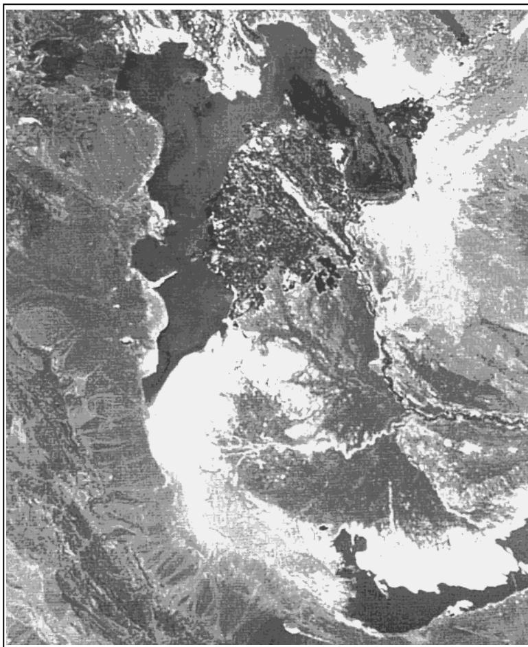
تصویر ۳: تصویر ماهواره‌ای از منطقه‌ی سیستان که در آن مسیرهای قدیمی و فعلی رودخانه‌ی هیرمند مشخص می‌باشد (تاریخ عکس‌برداری ۲۶ فروردین ۱۳۷۷)

دو کشور به دلیل همین تغییر مسیرهای هیرمند و شاخه‌های آن بوده است. اینک عطف توجه به این مهم و پی‌جویی روندهای آینده آن بر مبنای روندهای گذشته، می‌تواند راهبردهای روشنی را در مواجهه با این پدیده و کنترل و مهار آثار و تبعات سیاسی، اجتماعی و اقتصادی آن، فراروی برنامه‌ریزان سیاستگذاران ملی و منطقه‌ایی قرار دهد.