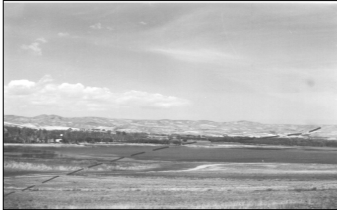
تصویر ۵: استخر طبیعی قوری گل (دید به سمت جنوب غرب)

و- تشکیل دریاچه‌ی ارومیه: این دریاچه نیز یکی از پدیده‌های ژئومورفولوژیکی موجود در منطقه می باشد که در اثر فعالیت گسل تبریز ایجاد شده است. فعالیت گسل تبریز در این قسمت سبب بالآمدگی قطعه‌ی شمالی این گسل شده و قطعه‌ی فوق‌الذکر با ایجاد مانعی درمقابل جریان آب، موجبات تشکیل دریاچه ارومیه را فراهم آورده است (تصویر ۶).