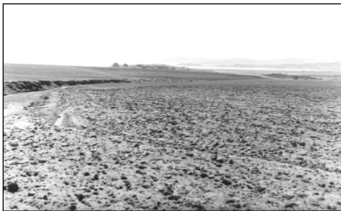
تصویر ۶: مسیر اتصال دریاچه ارومیه به قطورچای (دید به سمت جنوب غرب)

و- تشکیل دریاچه‌ی ارومیه: این دریاچه نیز یکی از پدیده‌های ژئومورفولوژیکی موجود در منطقه می باشد که در اثر فعالیت گسل تبریز ایجاد شده است. فعالیت گسل تبریز در این قسمت سبب بالآمدگی قطعه‌ی شمالی این گسل شده و قطعه‌ی فوق‌الذکر با ایجاد مانعی درمقابل جریان آب، موجبات تشکیل دریاچه ارومیه را فراهم آورده است (تصویر ۶).