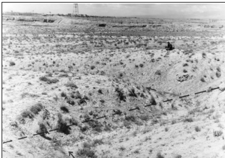
تصویر ۱: جابه‌جایی آبراهه‌ها در شمال غرب تبریز (دید به سمت جنوب غرب)

ب- ایجاد پرتگاه گسلی : فعالیت‌های جدید گسل تبریز سبب تشکیل این عارضه گردیده است.