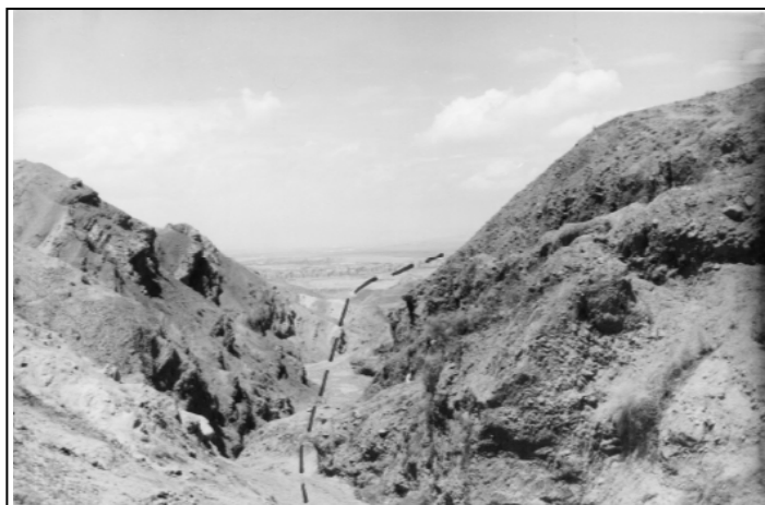
تصویر ۴: دره گسلی شمال تبریز (دید به سمت غرب)

د- چشمه‌های گسلی و آب‌های زاینده: چشمه‌های متعددی بر روی گسل تبریز وجود دارد که در اثر فعالیت این گسل ایجاد شده‌اند. عامل اصلی تمرکز روستاهای منطقه در امتداد گسل تبریز نیز وجود همین چشمه‌ها بوده است. همچنین در محدوده‌ی مورد مطالعه، آب‌های زاینده‌ای نیز وجود دارند که سبب رشد گیاهان و پوشش گیاهی منطقه گردیده اند.