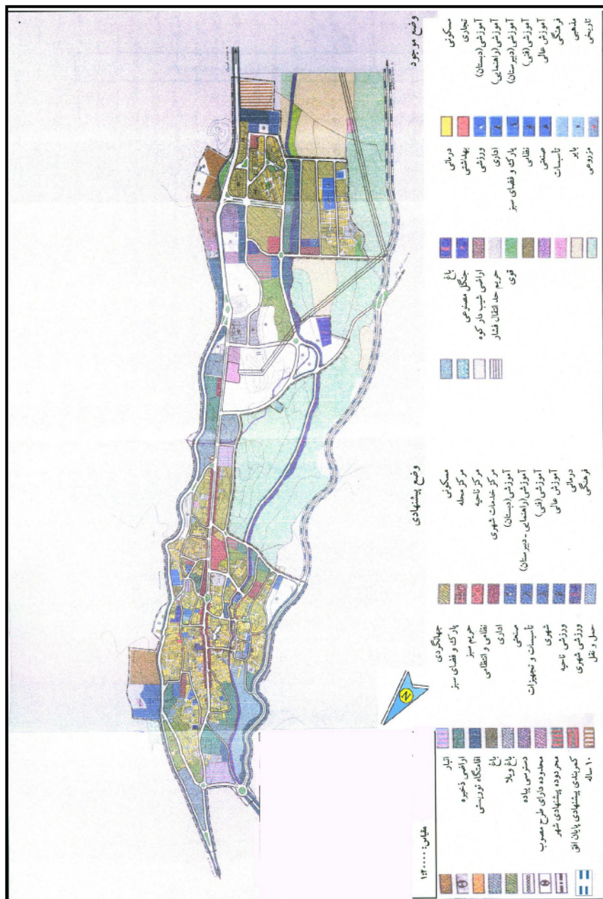
نقشه ۳: کاربری اراضی شهری در وضع پیشنهادی و توزیع فضایی آن در شهر اردکان فارس