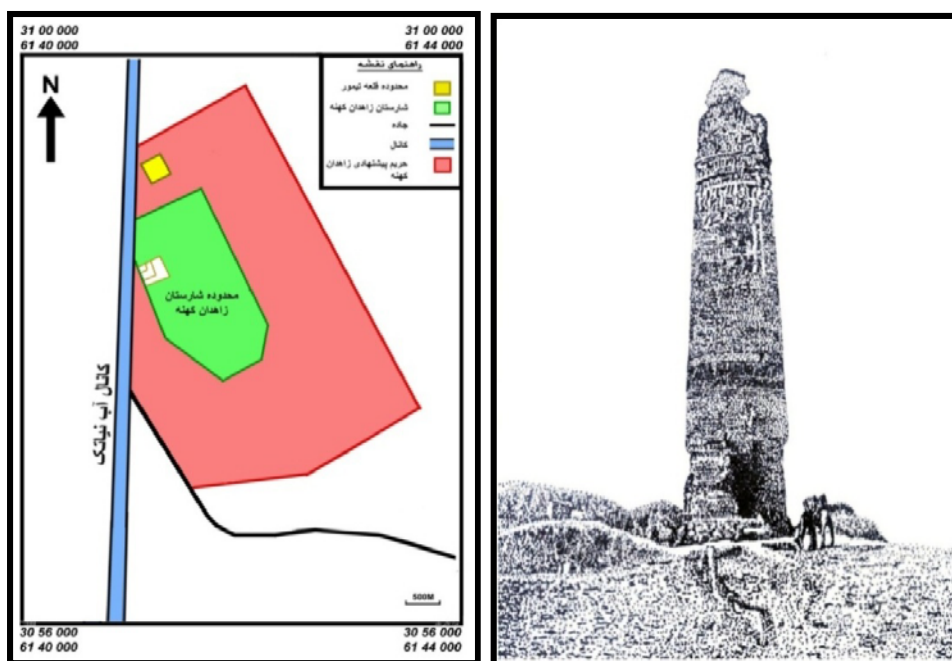
شکل ۴: میل قاسم‌آباد مأخذ: تیت، ۱۳۶۴: ۲۱۰