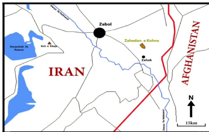
شکل ۱: موقعیت زاهدان کهنه در سیستان

شهر باستانی زاهدان کهنه در ۲۰ کیلومتری جنوب شرقی زابل، در شمال حوزه‌ی زهک سیستان و در ۷۰۰ متری شرق روستای جدید زاهدان واقع شده است (شکل ۱). از نظر مختصات جغرافیایی، زاهدان کهنه در ۴۱^{\circ}۰۵۶' طول شرقی و ۳۰^{\circ}۵۸.۵۸۷' عرض شمالی واقع شده و ارتفاع متوسط آن از سطح آب‌های آزاد ۴۸۵ متر است.