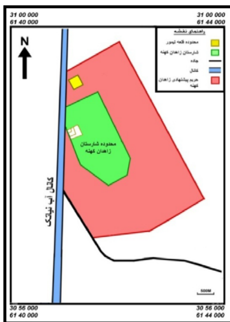
شکل ۵: موقعیت عرصه و حریم پیشنهادی زاهدان کهنه