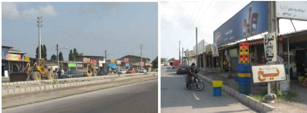
عکس ۲: آشفتگی بصری ناشی از تنوع بدون قاعده تابلوهای تجاری در مبادی ورودی شهر بابلسر