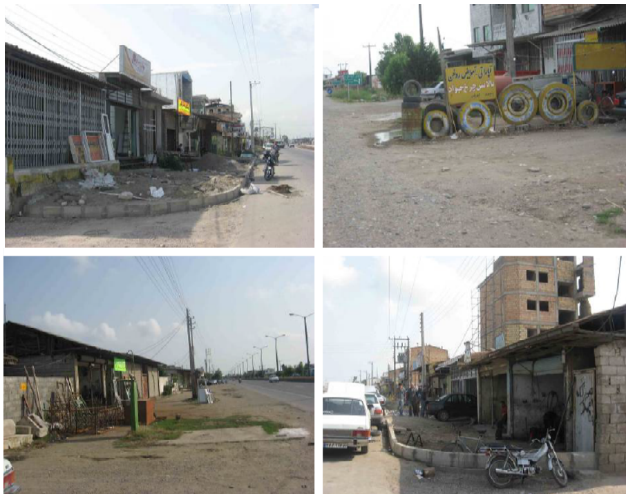
شکل ۲: استقرار کاربری‌های ناسازگار در جوار مبادی ورودی شهر بابلسر