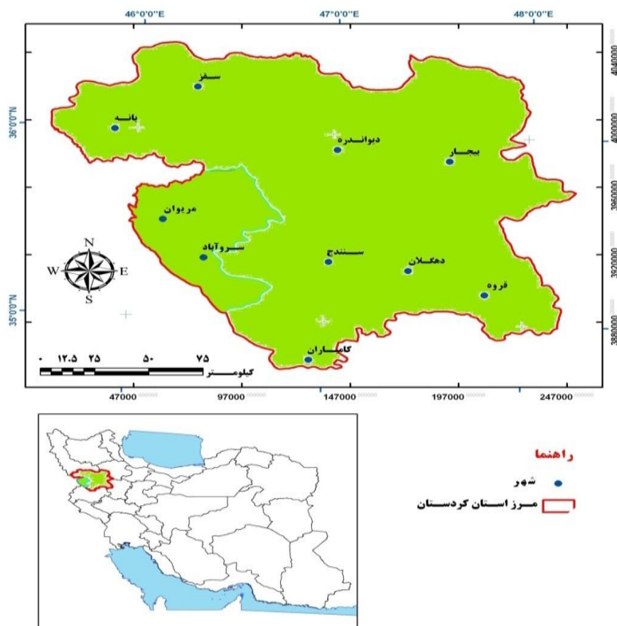
تصویر ۱: نقشه محدوده مورد مطالعه