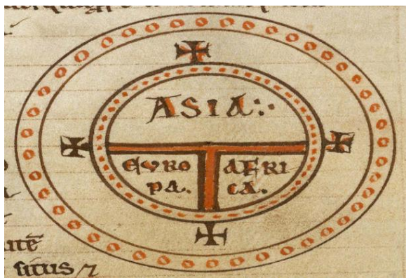
شکل ۲: نقشهٔ تی و او

سویلی» در سدهٔ پانزدهم میلادی در رسم این نقشه اعتقاد بر این بود که خداوند زمین را به شکل منظمی خلق کرده و قدس را در وسط آن قرار داده است. در این نقشه جهت شرق در بالا قرار دارد و جهان به شکل O (نشانهٔ Orbis یا کره و معرف صفحهٔ زمین است) و محصور در اقیانوس رسم شده و دریاهای سرخ، سیاه و مدیترانه در وسط آن به شکل حرف T دیده می‌شود که دلالت بر Terrorum یا زمینه است؛ رود نیل در سمت راست و رود دُن سمت چپ این دریاها قرار دارند؛ آسیا در نیمهٔ شمالی و اروپا در پایین نیمهٔ غربی و مقابل آفریقا قرار دارد (فنی، ۱۳۸۵: ۷۶).