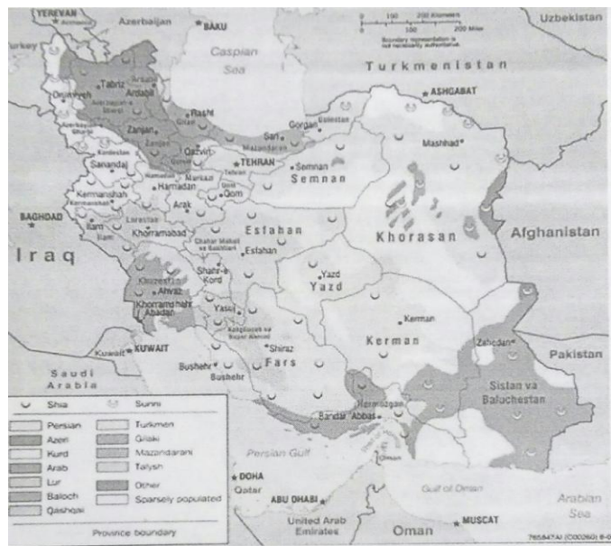
شکل ۶: توزیع فضایی قومیت‌های ایران

«به‌عنوان نمونه، در استان کرمانشاه که یک منطقه کردنشین محسوب می‌شود و درصد بیشتر شهرستان‌های این استان کرد هستند و فارس، لر و عرب در اقلیت هستند؛ ولی در نقشه، عمداً و از روی غرض، این طراحان نقشه‌اند که فارس را قوم غالب معرفی می‌کنند. نمونه عینی دیگر در این رابطه به آذربایجان غربی برمی‌گردد که در حالت معمول