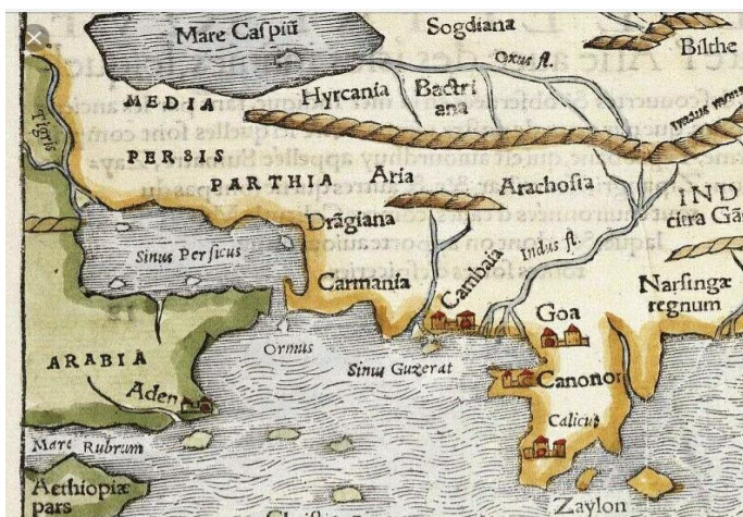
شکل ۳: یکی از نقشه‌های قدیمی خلیج فارس

در سال‌های اخیر مصرانه و مجدانه کوشش شده است تا نام خلیج فارس به «خلیج عربی یا خلیج» تبدیل شود و منافع ملی، اقتصادی، سیاسی و فرهنگی