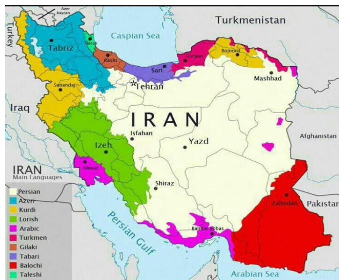
شکل ۵: پراکنش فضایی اقوام در ایران