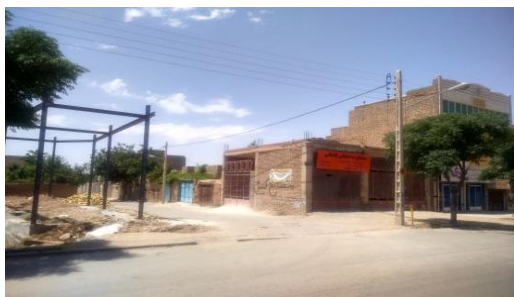
خیابان شیخ آذری