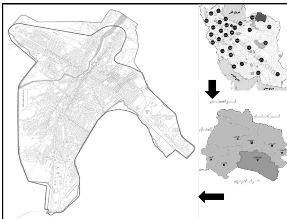
تصویر ۱: موقعیت و محدوده شهر اسفراین