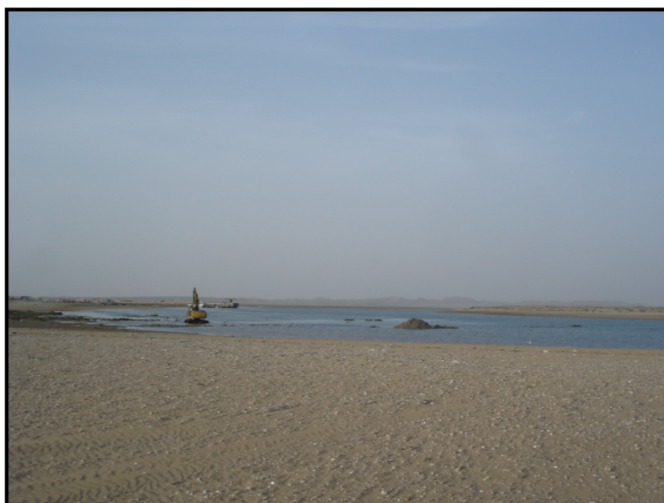
شکل ۲: بخشی از مدخل یا دهانه‌ی ورودی خورتنگ (Grow) که در تاریخ ۸۴/۱۲/۲۵ در حالت جزر توسط اداره کل شیلات استان سیستان و بلوچستان در حال لایروبی بود.