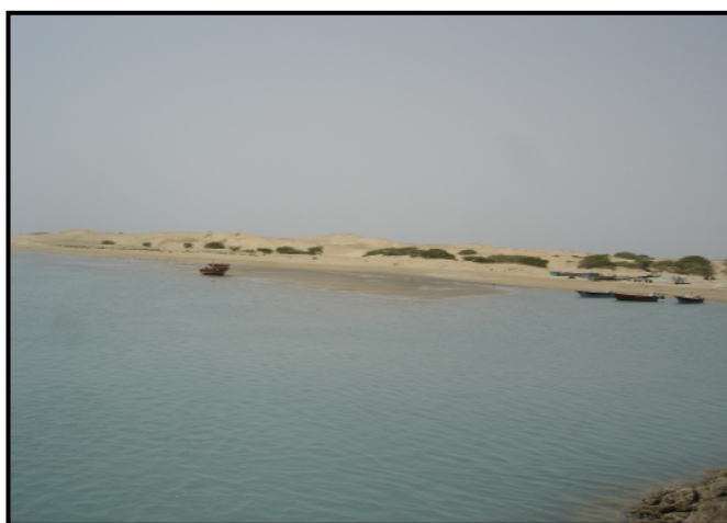
شکل ۷: تپه‌های ماسه‌ای که بر روی بخش میانی زبانه‌ی ماسه‌ای انباشته شده‌اند

تغذیه ماسه، از تراکم آن‌ها کاسته می‌شود و گاهی اوقات بدون آن که برجستگی مشخص و خاصی را ایجاد کنند، به صورت ماسه‌های پراکنده در سطح زمین گسترده شده‌اند و با وزش باد از جایی به جای دیگر منتقل می‌شوند، ولی اگر ماسه‌های روان به مانعی برخورد کنند، برخان، نبکا... را تشکیل می‌دهند. تپه‌های ماسه‌ای ساحلی منطقه‌ی مورد مطالعه بیشتر در شرق، جنوب شرقی و همچنین شمال غربی خور تنگ تمرکز دارند و بیشتر بر اثر طوفان‌های شدید دریایی که جهت غالب آنها جنوب غربی - شمال شرقی است به وجود آمده‌اند. این تپه‌ها که ارتفاع برخی از آنها به بیش از ۱۰ متر نیز می‌رسد، منشاء دریایی دارند و دارای پوسته‌ی خرده شده صدف‌های دریایی هستند و هر چه از دریا دور می‌شوند از درصد صدف‌ها کاسته می‌شود. تپه‌های ماسه‌ای ساحلی علی‌رغم داشتن رطوبت، توسط بادهای شدید و قوی، اندکی جابجا می‌شوند و هر چه از دریا فاصله می‌گیرند، سرعت جابجایی آنها به خاطر کاهش رطوبت، افزایش می‌یابد. تپه‌های ماسه‌ای معمولاً از ماسه‌های ریز با جور شدگی نسبتاً خوبی تشکیل شده‌اند و مقدار سیلت در این رسوبات بیشتر از رسوبات ساحلی می‌باشد ولی پوسته صدف‌های دریایی آنها کمتر از رسوبات ساحلی است. تپه‌های ماسه‌ای ساحلی در شمال غربی خور تنگ حدود ۴ کیلومتر در امتداد ساحل و تقریباً ۷ کیلومتر در داخل خشکی توسعه پیدا کرده‌اند. در صورتی که این تپه‌ها در جنوب شرقی خور ۶ تا ۹ کیلومتر به موازات ساحل گسترده شده‌اند و توسعه‌ی آنها به داخل خشکی نیم تا ۱/۵ کیلومتر است. تپه‌های ماسه‌ای کم ارتفاع بخش اعظم سطح زبانه‌ی ماسه‌ای و همچنین تومبولو و سواحل بالا آمده‌ی منطقه را نیز پوشانده‌اند.