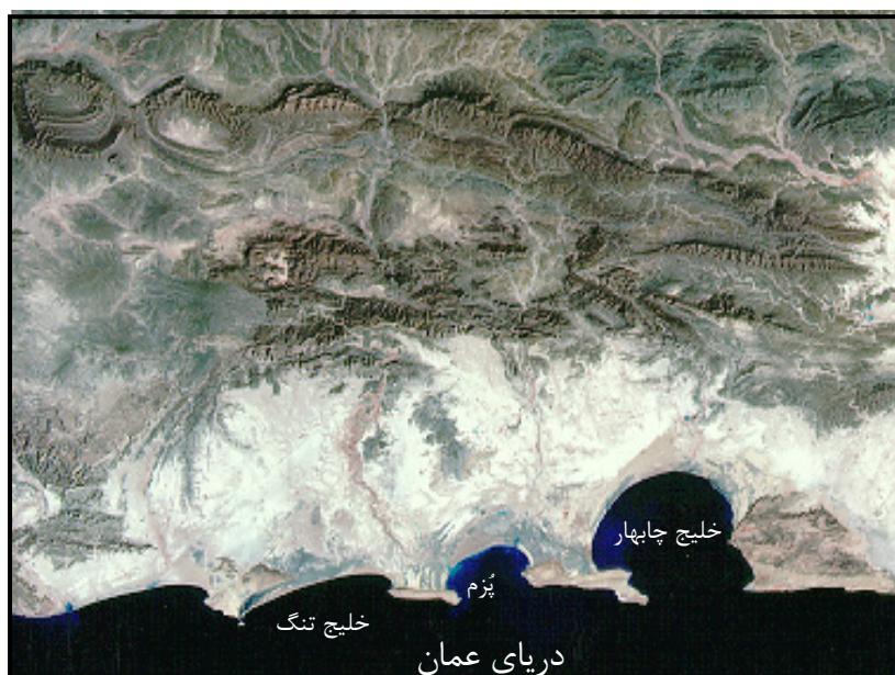
شکل ۱: موقعیت خلیج تنگ نسبت به دریای عمان و خلیج‌های بیرامون آن (تصاویر ماهواره‌ای لندست ۱:۰۰۰۰۰۰ ایران)

ساحل، رسوب‌گذاری، فرسایش و تخریب ساحل، تغییر پسرکرانه، سیل و سیلاب، حفاظت مرداب‌ها و خورها، مدیریت ساحل... حساسیت ویژه‌ای داشته و نقش مؤثر و بسزایی دارد (کوک، ۱۳۷۸: ۱۵۸). بدیهی است که مدیریت ساحل بدون شناخت عناصر پدیده‌های ژئومورفولوژی آن میسر نیست. از این رو برای تحقق این امر ابتدا موقعیت و مشخصات خلیج تنگ را مورد بررسی قرار می‌دهیم و سپس به شرح پدیده‌های ژئومورفولوژیکی آن خواهیم پرداخت. در امتداد سواحل دریای عمان خلیج‌های کوچک و بزرگ متعددی وجود دارد (مثل چابهار، گواتر، پُرم و غیره) که اکثراً به شکل نعل اسبی یا نیم دایره‌ای هستند ولی خلیج تنگ که بین آبادی گوردیم و بندر تنگ قرار دارد، به علت پسروی آب دریا و پست بودن ساحل و همچنین حجم زیاد رسوب‌هایی که به آن وارد شده است، بتدریج شکل نیم دایره‌ای و نعل اسبی (یا اُمگا شکل) خود را از دست داده و در حال حاضر فقط قوسی از آن باقی مانده است (Snead, 1970 :502).