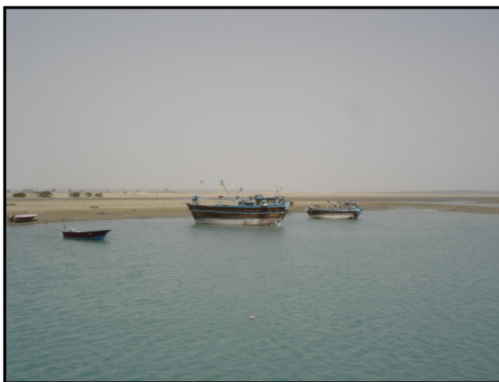
شکل ۳: بخشی از ساحل پست ماسه‌ای و کانال جزر و مدی خور تنگ در حالت مد

گرچه وجود خور و کانال‌های جزر و مدی در این منطقه پناهگاهی مطمئن برای قایق‌های موتوری و لنج‌های صیادی است و از دسترس طوفان‌ها و امواج شدید دریا در امان هستند، ولی در هنگام جزر وسایل مذکور به گل می‌نشینند و باید منتظر رسیدن مد و بالآمدن آب دریا بشوند تا قادر به حرکت به سمت دریا باشند.