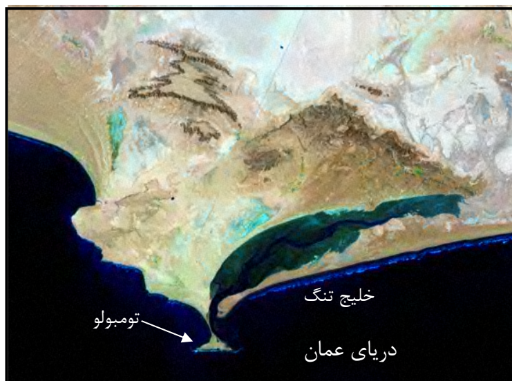
شکل ۶: موقعیت تومبولو در دریای عمان و خلیج تنگ (با استفاده از تصاویر ماهواره‌ای رقومی منطقه)

توپوگرافی ۱:۵۰۰۰۰ منطقه، ۱۷۰۰ متر و کمترین عرض آن ۲۵۰ متر برآورد شده است. ارتفاع خود تومبولو از سطح دریا حدود ۲ تا ۹ متر است ولی ارتفاع تپه‌های ماسه‌ای ساحلی که بر روی آن قرار دارند، به حدود ۱۶ متر می‌رسد. رسوبات ساحلی ریزدانه در پای تومبولو دور تا دور آن را احاطه کرده‌اند.