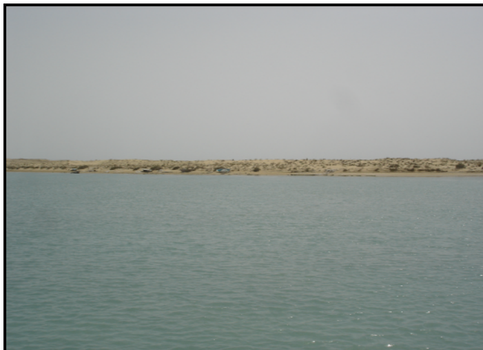
شکل ۵: بخشی از زبانه‌ی ماسه‌ای که از شرق به غرب گسترش یافته و ماسه‌های بادی قسمت‌هایی از روی آن را پوشانده‌اند

جنس زبانه‌ی ماسه‌ای همان‌طور که از اسم آن پیداست، بیشتر شن و ماسه است و مقدار رس آن خیلی زیاد نیست. جور شدگی نسبتاً خوبی در آنها مشاهده می‌شود و قطر اکثر ذرات آن کمتر از ۲ میلیمتر است و به علت جابجایی دایم توسط امواج دریا، از گرد شدگی خوبی برخوردارند. نوک این زبانه‌ی ماسه‌ای که دائماً در حال گسترش از شرق به غرب است، تا کنون بارها تغییر مکان داده و باعث شده است که دهانه خورتنگ چندین مرتبه جابجا شود (شرکت سهامی شیلات ایران، ۱۳۷۲: ۱۰-۷۹).