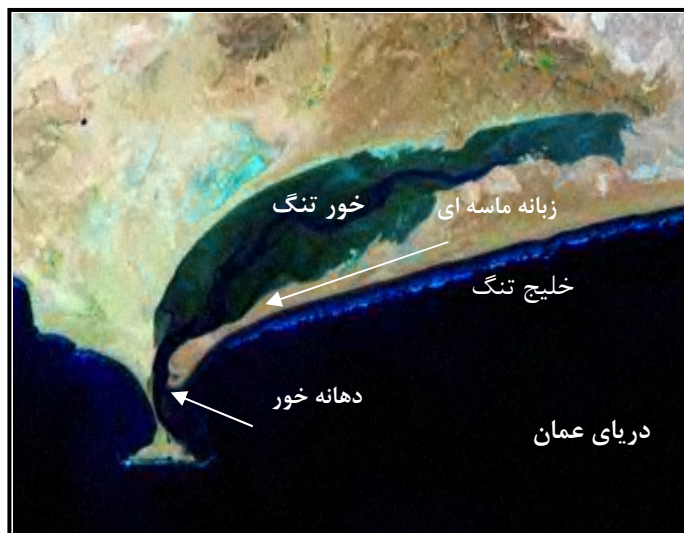
شکل ۴: شکل خور تنگ و زبانه‌ی ماسه‌ای حاشیه‌ی آن (با استفاده از تصاویر ماهواره‌ای رقومی منطقه)