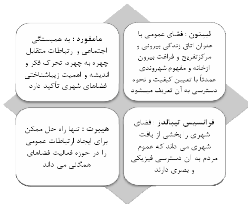
شکل ۲: مفاهیم مورد تأکید نظریه پردازان در ارتباط با فضای عمومی