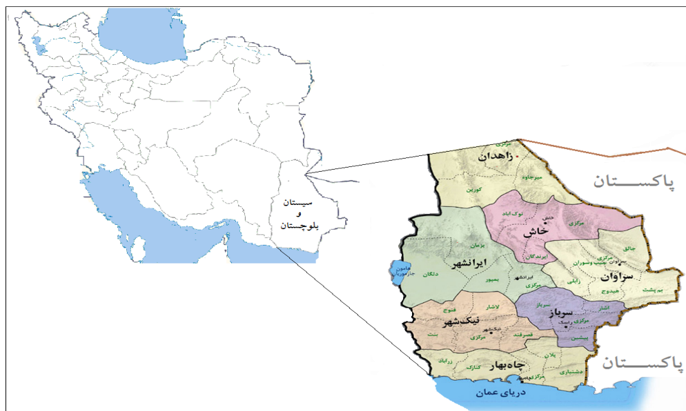
نقشه ۱: مرزهای ایران و پاکستان

دسیسه‌های انگلستان و تقسیم بلوچستان مرزهای ایران و بلوچستان (هند انگلیس) مشخص شد. ایران دارای ۹۲۴/۸ کیلومتر مرز مشترک با پاکستان است که ۶۱۳/۴ کیلومتر از آن مرز خشکی و ۳۱۱/۴ کیلومتر مرز آبی است (اخباری و نامی، ۱۳۸۹: ۱۷۸). مرز ایران و پاکستان از ملک‌سیاه‌کوه شروع می‌شود و از مشرق رباط، میرجاوه و خاش عبور می‌کند و به رود تهلاب متصل می‌شود. سپس از شمال و مشرق کنده‌گذشته و به سیاه‌کوه می‌رسد و از آنجا تا مقابل تپه کورکیان به سمت جنوب امتداد می‌یابد و با رود ماشکل تلاقی می‌کند. از آنجا در مسیر رودخانه به سمت غرب می‌رود؛ سپس با گذر از عرض رودخانه در شرق بندر گواتر به دریای عمان منتهی می‌شود (حافظ‌نیا، ۱۳۸۱: ۳۰۹).