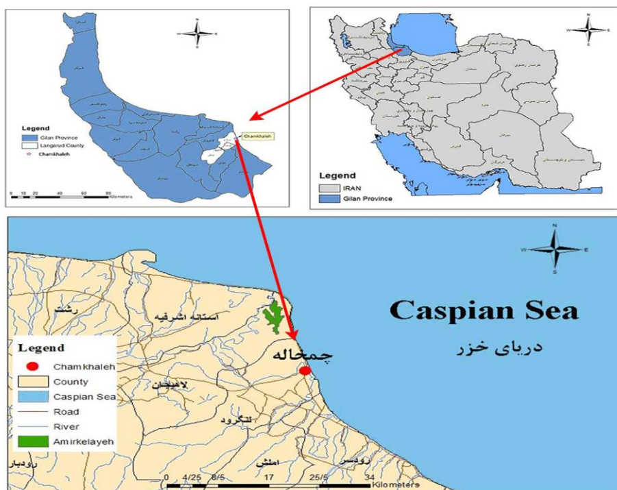
شکل ۱: موقعیت منطقه مورد مطالعه در استان گیلان

پشتیبانی و منطقه عملیاتی است. منطقه پشتیبانی به وسعت ۷ هکتار، محوطه عمومی سایت را دربرمی‌گیرد. در این محوطه کلیه امور پشتیبانی و اداری و گردشگری صورت می‌پذیرد و ۲۶ درصد از سایت را شامل می‌شود. فعالیت عمده بندر در بخش