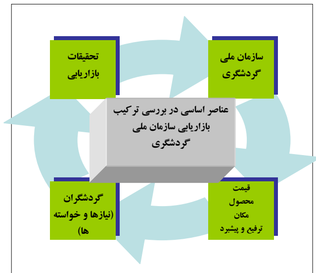
شکل ۲: عناصر اساسی در بررسی ترکیب بازاریابی سازمان ملی گردشگری مأخذ مطالب: (اسلام، ۱۳۸۲: ۲۷۵) تهیه شکل: پژوهشگران

مهمترین هدف بازاریابی گردشگری داخلی جلب هر چه بیشتر دیدارکنندگان از منطقه‌ای خاص است. به همین دلیل باید تصویر روشنی از امکانات، جاذبه‌ها و چگونگی دسترسی به آنها را فراهم آورد.