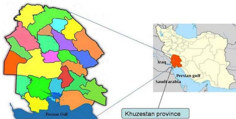
شکل ۲: نقشه استان خوزستان

استان خوزستان، استانی در جنوب غربی ایران است که در کرانه خلیج فارس قرار دارد. مساحت استان خوزستان ۶۴۰۰۵۷ کیلومتر مربع است و با جمعیتی حدود ۴/۵ میلیون نفر، به‌عنوان پنجمین استان پرجمعیت ایران محسوب می‌شود. خوزستان از شمال به استان لرستان، از شمال‌شرقی و شرق به استان چهارمحال و بختیاری، از شمال‌غربی به استان ایلام، از شرق و جنوب‌شرقی به استان کهگیلویه و بویراحمد، از جنوب به استان بوشهر و خلیج فارس و