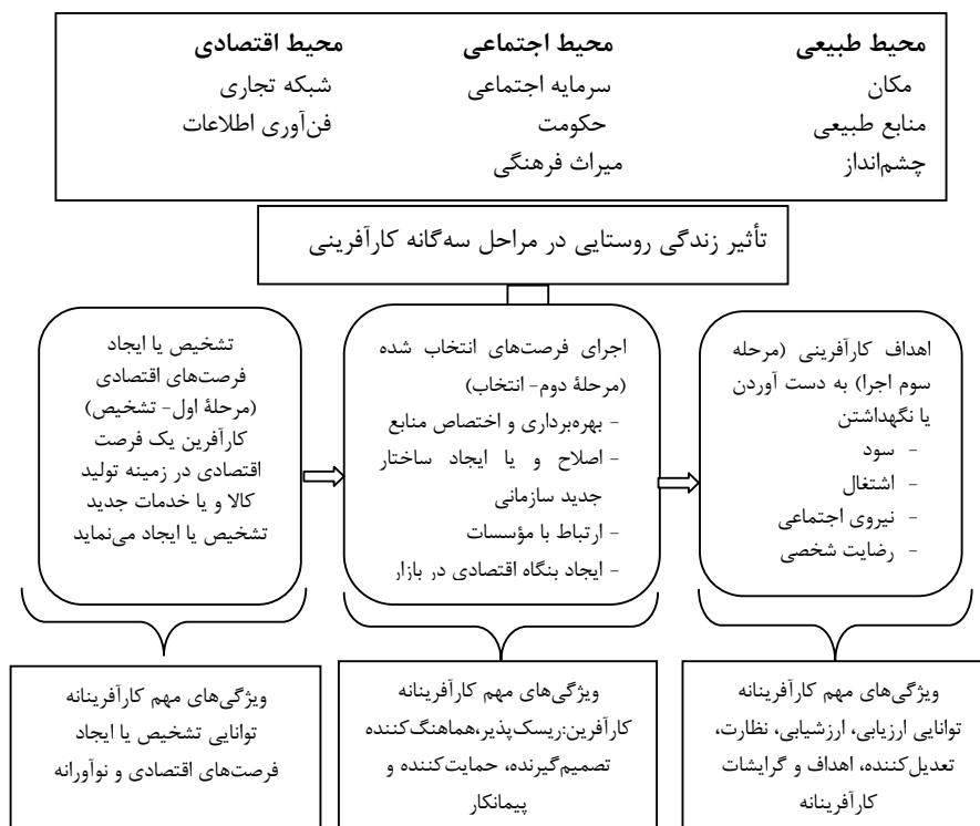
شکل ۱: عوامل ظرفیتی تأثیرگذار در توسعه کارآفرینی محیط‌های روستایی

هزینه‌های هنگفتی به وجود آمده و حفظ شده است؛ به همین دلیل، توجه به این ظرفیت‌ها از دو جنبه دارای اهمیت است: اول اینکه از حداکثر توان خدمت‌دهی ظرفیت‌های موجود باید استفاده کرد؛ دوم اینکه در توسعه‌های درون‌زا، با وجود ظرفیت‌های توسعه در مناطق روستایی، نیاز کمتری به ایجاد زیرساخت‌ها و امکانات تازه خواهد بود. بر این اساس استفاده از ظرفیت‌های محلی برای توسعه به عنوان یکی از اهداف اساسی توسعه محلی در کشورهای مختلف است. یکی از زمینه‌هایی که می‌توان از ظرفیت‌های محلی برای توسعه استفاده کرد، توسعه کارآفرینی می‌باشد. این امر به‌ویژه در مناطق روستایی و کارآفرینی روستایی بسیار مهم و ضروری است.