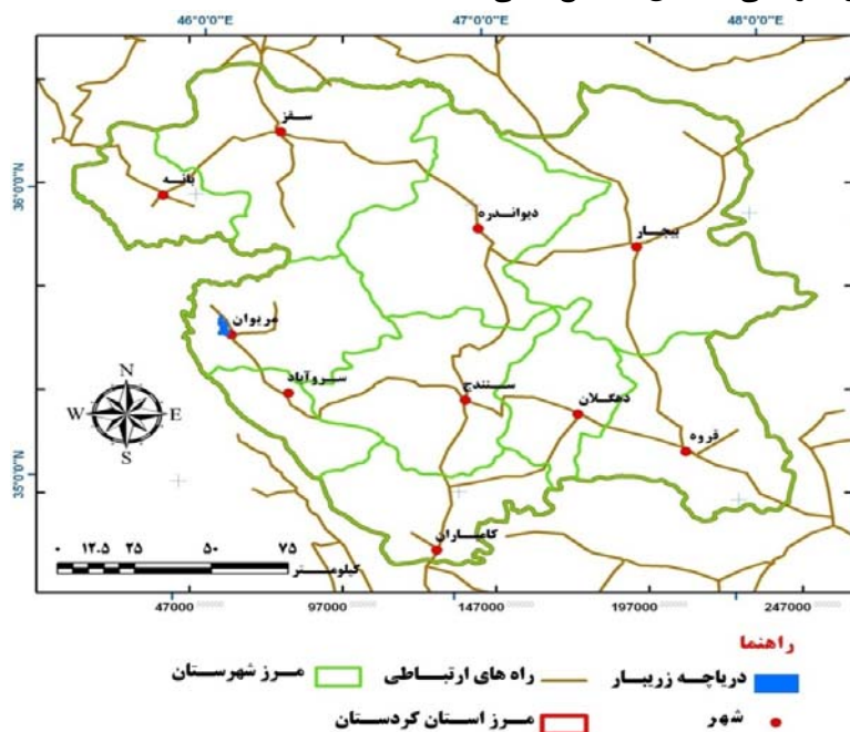
شکل ۱: موقعیت دریاچه زریوار مریوان

گرفته است. دورتادور دریاچه را کوه‌های پوشیده از جنگل فراگرفته و به زیبایی آن افزوده است. طول دریاچه ۴/۵ کیلومتر و عرض آن حدود ۲ کیلومتر می‌باشد و مساحتی حدود ۸۵۰ تا ۹۰۰ هکتار را در بر گرفته است عمق متوسط دریاچه ۳ متر (۲ الی ۵ متر) بوده که از نظر عمق، وسعت و حجم آب شرایط بسیار مناسبی برای قایقرانی و اسکی روی آب فراهم نموده است. موقعیت جغرافیایی شهرستان مریوان و وجود بازارچه مرزی رسمی باشماق، صنایع‌دستی،