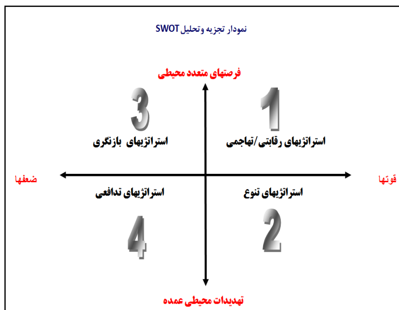
شکل ۳: نمودار تجزیه و تحلیل SWOT و انواع استراتژی‌ها